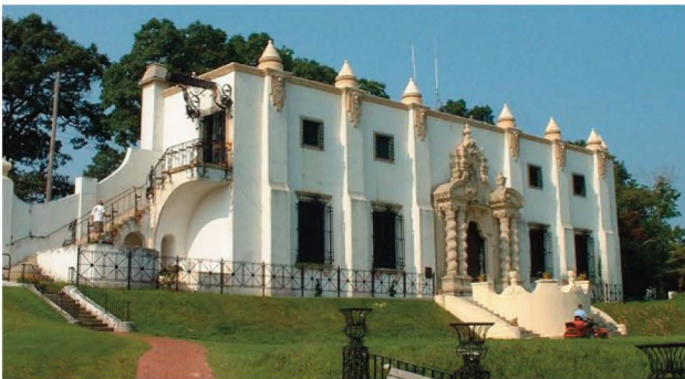
Museo Marino / Salón de los Peces