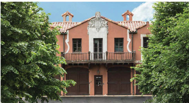
Centro de Aprendizaje / Garaje